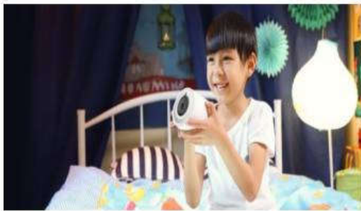
乐视乐小宝故事光机