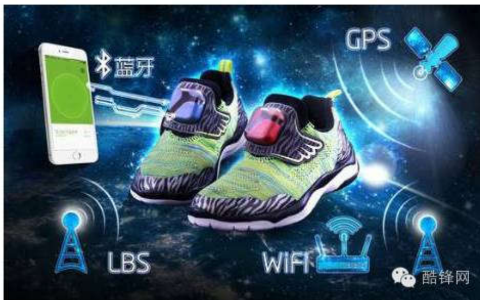
步丢智能定位童鞋

陪护类：陪护类儿童智能产品，一般指那种凭借强大的语音功能，可以与儿童进行简单日常交流的产品，多以小型机器人居多。