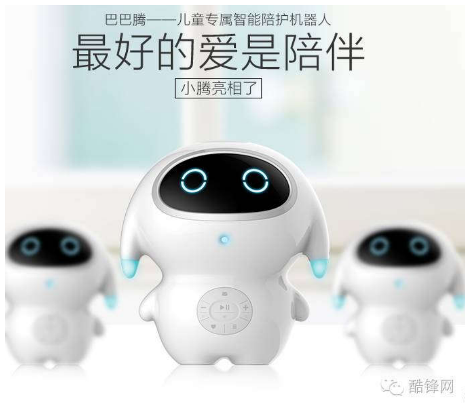
巴腾智能陪护机器人

实用类：儿童智能产品，则涵盖的范围比较广，一般涉及到儿童的日常生活、学习等方面，如智能牙刷、智能台灯。