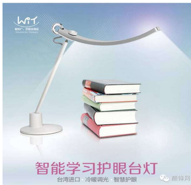
明基智能护眼学习台灯