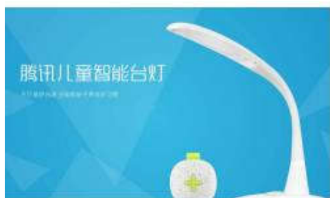
腾讯儿童智能台灯