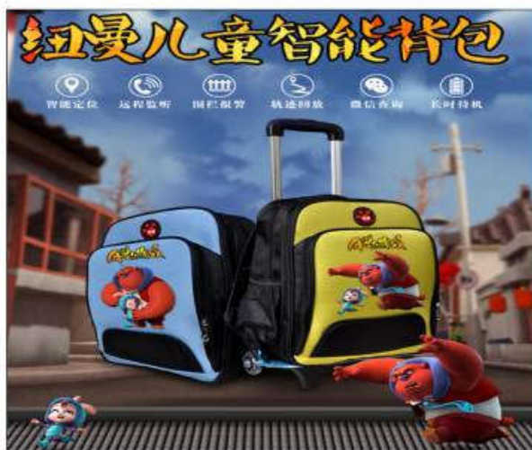
纽曼儿童智能书包

纽曼儿童智能书包在传统的书包基础之上增加APP交互方式，内GPS芯片，实现远程监听功能。