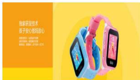
乐视Kido智能儿童4G手表

1.Kido Watch创新地使用了博通公司的LTO星历辅助定位技术，功耗更低，确定坐标速度更快。