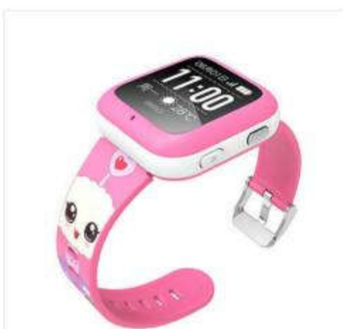
360巴迪龙儿童智能手表