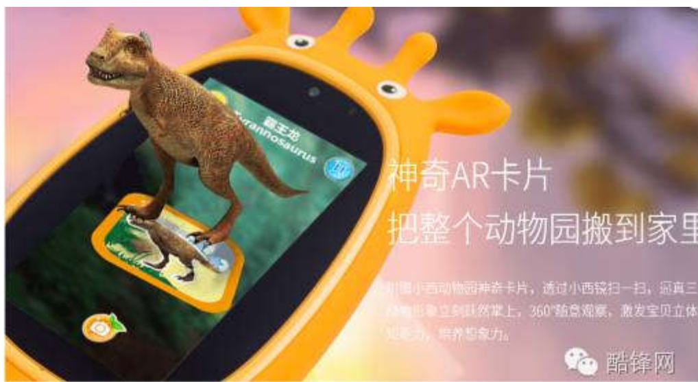
小西镜 AR 技术 巨头布局儿童智能领域