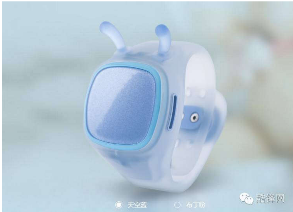
糖猫智能儿童手表