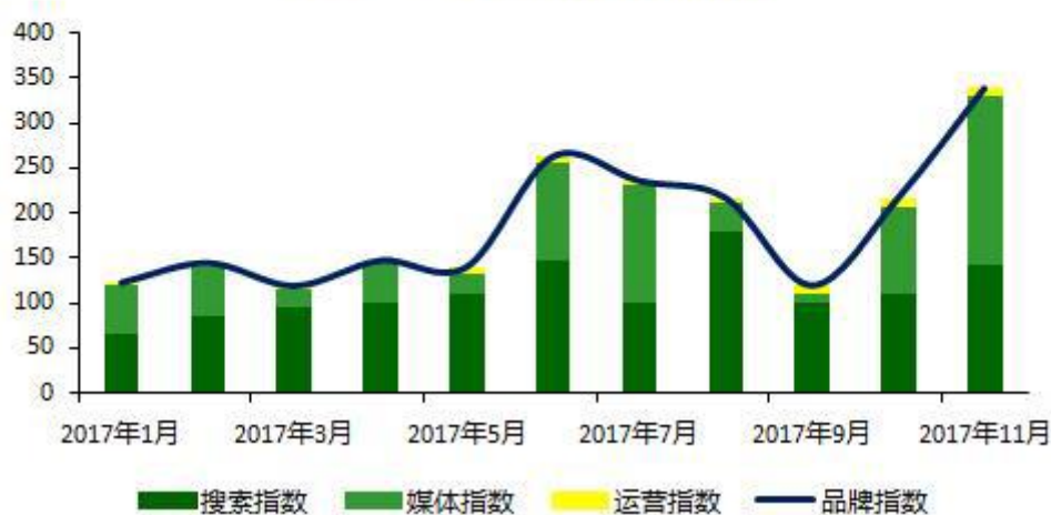
2017年以来蛋壳品牌指数

2017 年 4 季度以来，蛋壳公寓在搜索及媒体指数表现优异。关注度上，蛋壳的搜索虽然仍集中在北京地区，但其品牌影响力已逐渐向广东、上海和浙江等地区扩散。在媒体维度上，蛋壳公寓 11 月份联合多家大型媒体推出房震节活动，力图将其打造成为公寓租赁界的“双 11”狂欢，赢得了公寓市场的普遍关注。